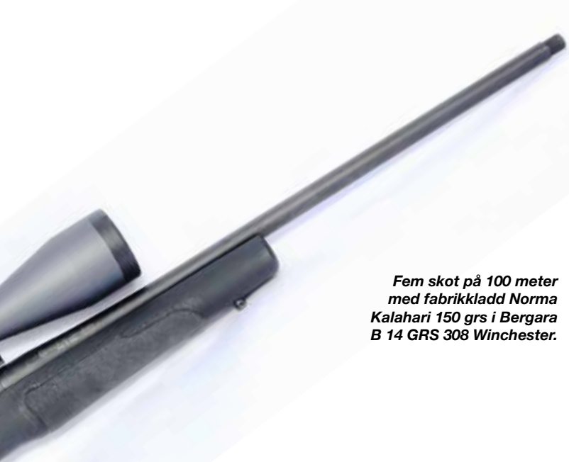
Fem skot på 100 meter med fabrikkkladd Norma Kalahari 150 grs i Bergara B 14 GRS 308 Winchester.